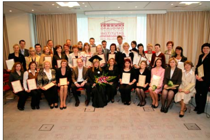
Sertifikatų įteikimas VšĮ Draudimo ir rizikos valdymo instituto absolventams, 2008 m.

Mėgėjiškas filmavimas ir vaizdo klipų montavimas.