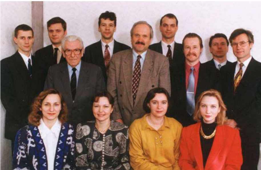
Draudimo bendrovės „Tukana“ kolektyvas 1993 m.