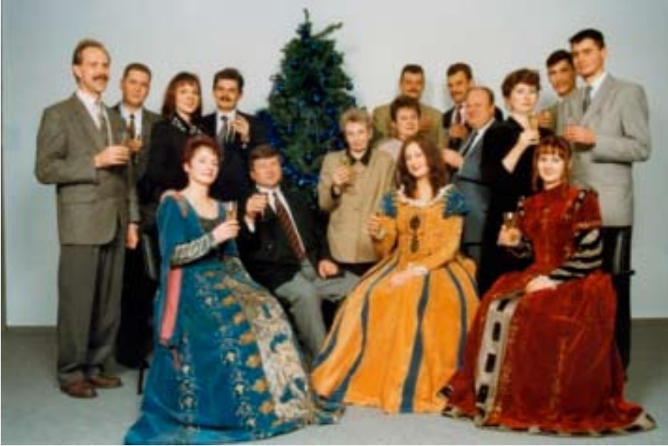
Draudimo bendrovės „Verslo draudimas“ kolektyvas pasitinka 1998 metus.